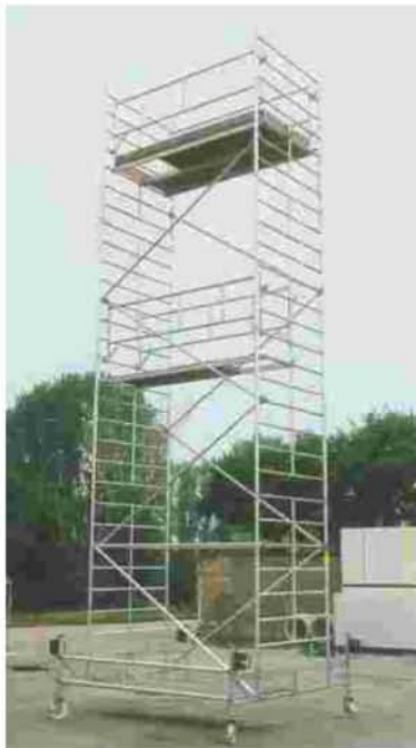
Die drei Aufbaubereiche