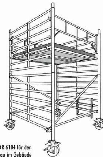
Typ AR 6104 für den Aufbau im Gebäude

Maximale Standhöhe = 4,40 m Plattformgröße = 2,60 x 1,20 m Außenbreite Vertikalrahmen = 1,60 m